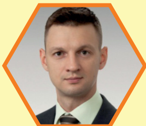
ФАДЕЕВ Александр Сергеевич